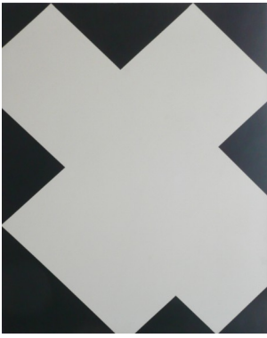
Christian Floquet, Sans titre, 1986 - Acrylique sur toile, 100 x 75 cm

contraindre » son impulsion dans des aplats de couleur formant des compositions épurées et par le biais de l'utilisation non plus de pinceaux mais de rouleaux. Christian Floquet reconnaît : « La subjectivité du coup de pinceau ou du geste, c'est quelque chose qui ne m'intéresse pas. C'est une fausse subjectivité. Il faut essayer de mettre sa subjectivité ailleurs ». Pour lui, c'est le fait de s'engager pleinement dans les choix de composition, de couleurs et de formes qui rendent ses œuvres subjectives, au contraire d'une peinture considérée par lui comme froide parce que programmée mathématiquement, par exemple. C'est pourquoi Arnault Pierre parle d' « engagement sans épanchement » au sujet de l'art de Christian Floquet.