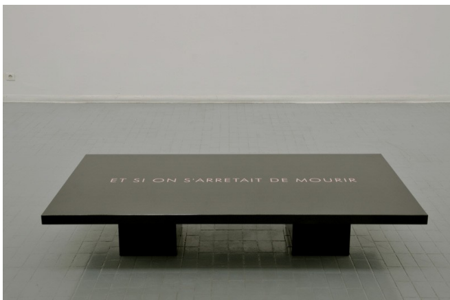
Jérôme Conscience, Et si on s'arrêtait de mourir , 2010 Granit, 180 x 100 x 35 cm

La galerie Barnoud présente ET SI ON S'ARRÊTAIT DE MOURIR , une proposition de Jérôme Conscience (né en 1976 à Besançon), dont l'œuvre polymorphe – sont présentées une sculpture, des photographies, des vidéos et des toiles peintes – interroge au moyen du langage le langage lui-même, le passage du temps, les relations entre l'artiste et son modèle, le désir et la sexualité.